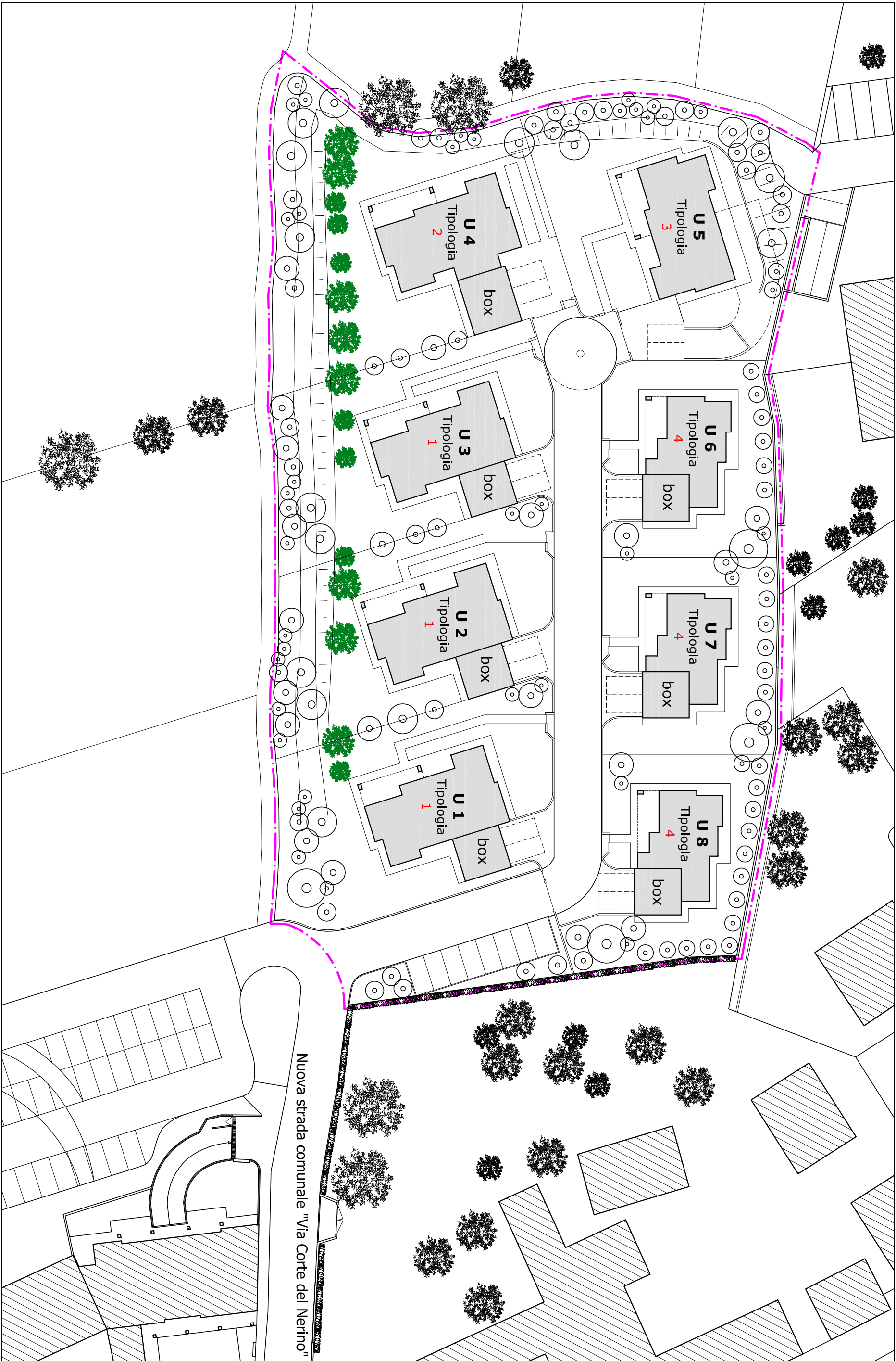
SCHEMA DEL VERDE